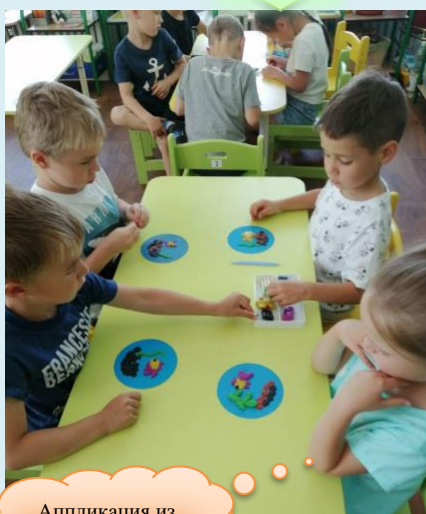
Аппликация из пластилина «Аквариум»