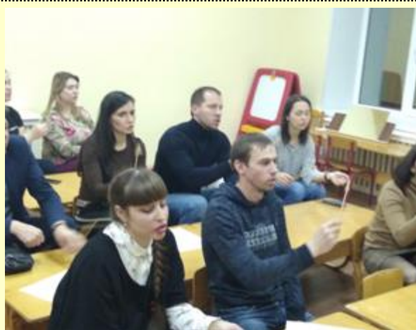
Зрительная гимнастика «Елочка»

В тесном сотрудничестве родителей и воспитателей было принято решение о совместной работе по укреплению здоровья и физическому развитию детей группы «Лучик».