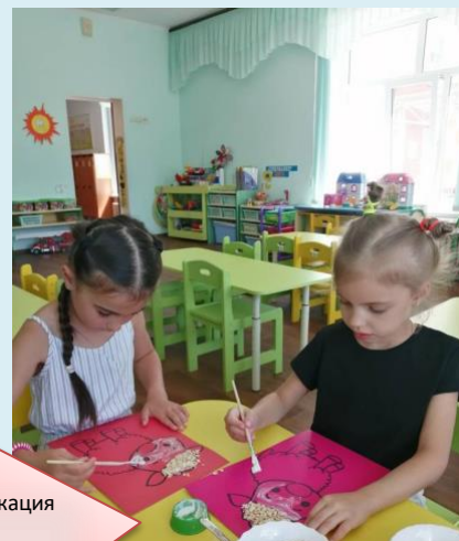
Аппликация Из круп