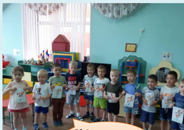
Объёмная аппликация «Удивительный цветок»