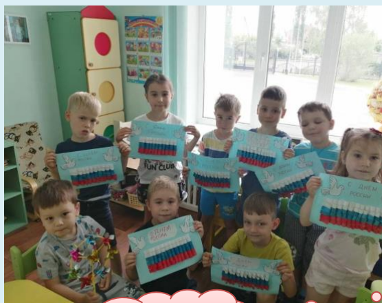
Аппликации ко дню России