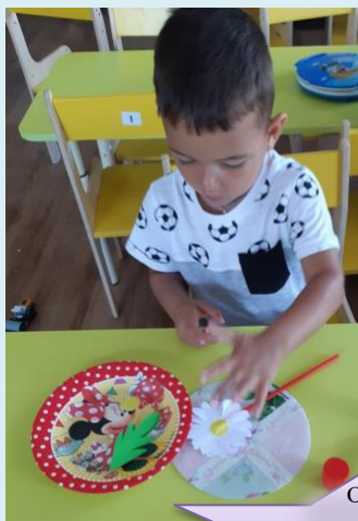
Объёмная аппликация «Ромашка»