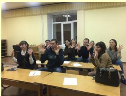
Пальчиковая гимнастика «Снежок».