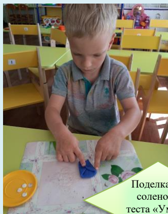
Поделка из солевого теста «Умная сова»