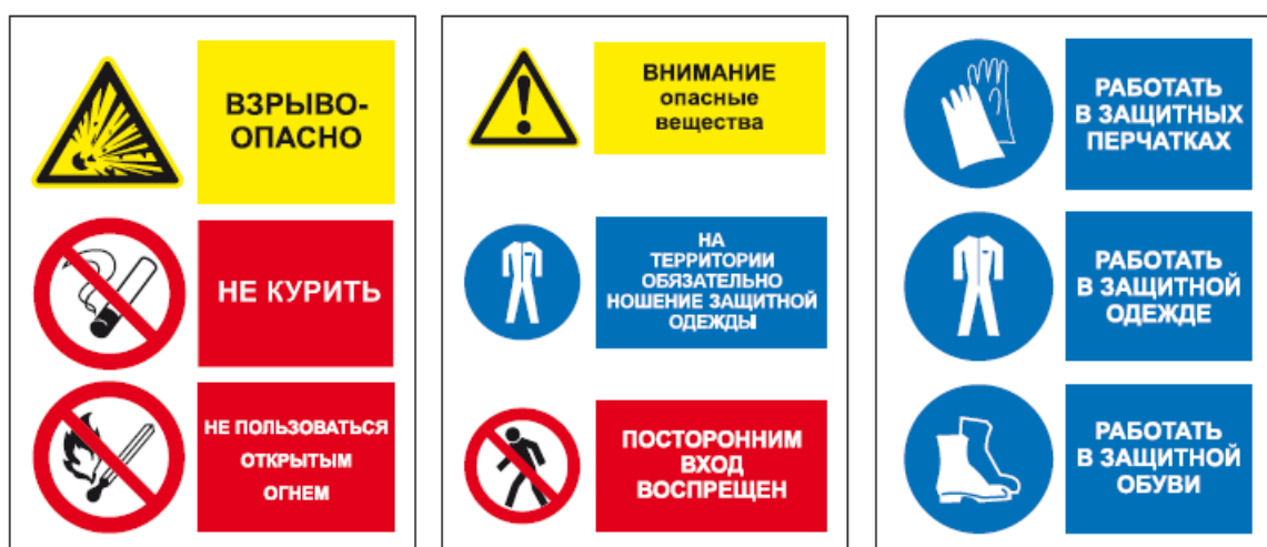
Рисунок Г.2 - Примеры групповых знаков