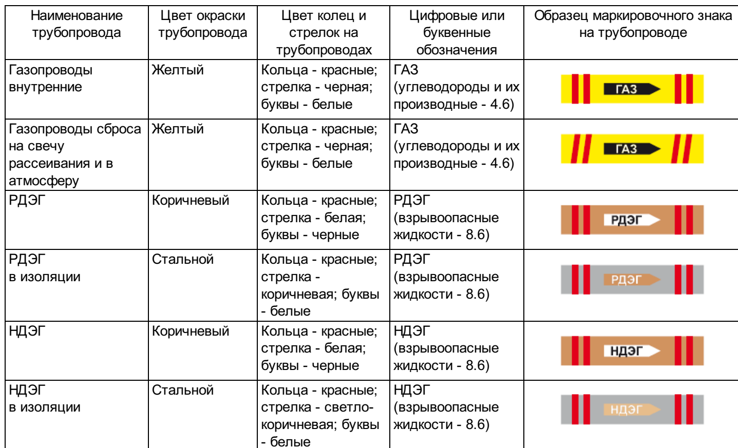
Таблица Ж.1 - Опознавательная окраска коммуникаций с расшифровкой отличительных цветов и цифровых обозначений

Опознавательная окраска коммуникаций с расшифровкой отличительных цветов и цифровых обозначений в соответствии с ГОСТ 14202 приведена в таблице Ж.1.