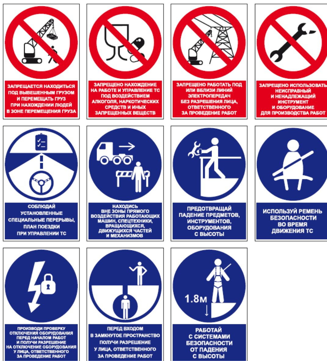
Рисунок Г.1 - Примеры комбинированных знаков