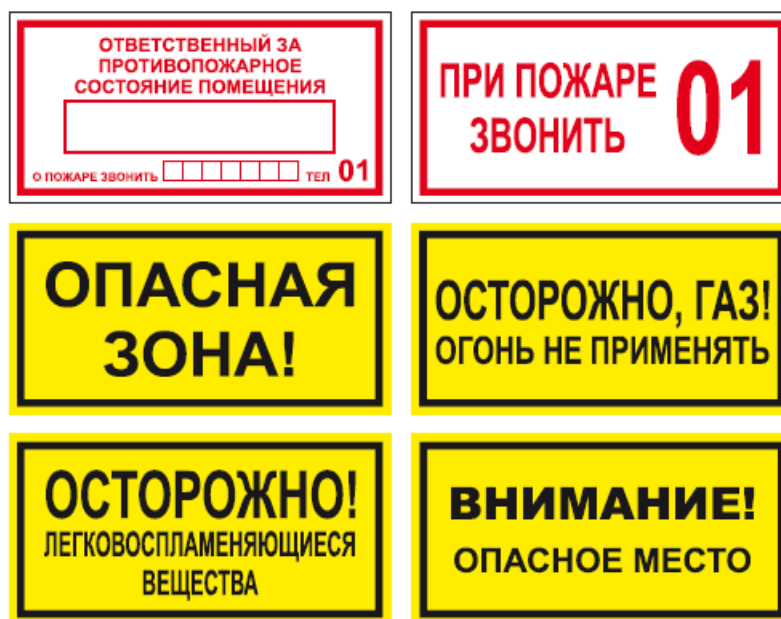
Рисунок Г.3 - Примеры дополнительных знаков безопасности